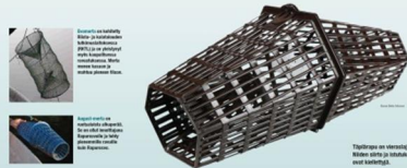
Täplämeri on yleensä 100 cm pitkä ja 10 cm leveä. Rapurosvo on yleensä 100 cm pitkä ja 10 cm leveä.

Isoit tavat eivät yleensä syvennä kuin pienet ravut ja täplämerit syvennä kuin jokivä.