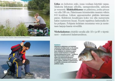
Koulutus Ammattiohjeisto Livia Kalastus- ja ympäristötoimisto Parainen

Vahelaus on yleisellä tavalla alle 10 v ja 65 v rinta- neet - maksuton kalastusmuoto.