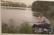
Kalastajien tulee jättää valtion kalastusohjelmaksi.

Pilkkimisessä käytetyn vavan tulee olla lyhyehkö, korkeintaan metrin mittainen. Kalastus katsotaan pilkkimiseksi, kun käytössä on lyhyehkö vapa ja pysty- suunnassa liikuteltava pilkki. Pilkinä voidaan käyttää myös vieheitä, kuten lusik- kausintia, kunhan kalastustapa on selvästi pilkkimistä.