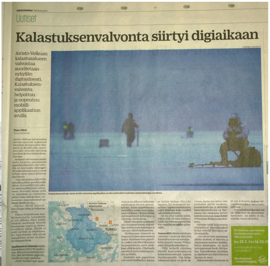
Kuva: ”Kalastuksenvalvonta siirtyi digiaikaan” artikkeli oli esillä Turun sanomissa 21.2.2017

Järjestettiin kalastuksenvalvojille toisen asteen kursssit 22.3.2017. Sähköisen valvontatyökalun koulutuksia pidettiin Imatralla 5.4., Rantasalmella 15.6. ja Vilppulassa 19.6. ja Lahdessa 20.6.2017. Valvontatyökaluohjelmalla on lähes 80 käyttäjää eri puolille Suomea. Tiedotettiin uudesta työkalusta sähköpostilla ja tilaisuuksissa eri puolilla maata.