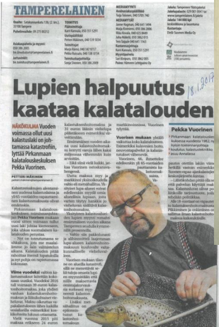
Kuva: ”Lupien halpautus kaataa kalatalouden” artikkeli oli esillä mm. Vantaan sanomissa ja tamperelaisessa.