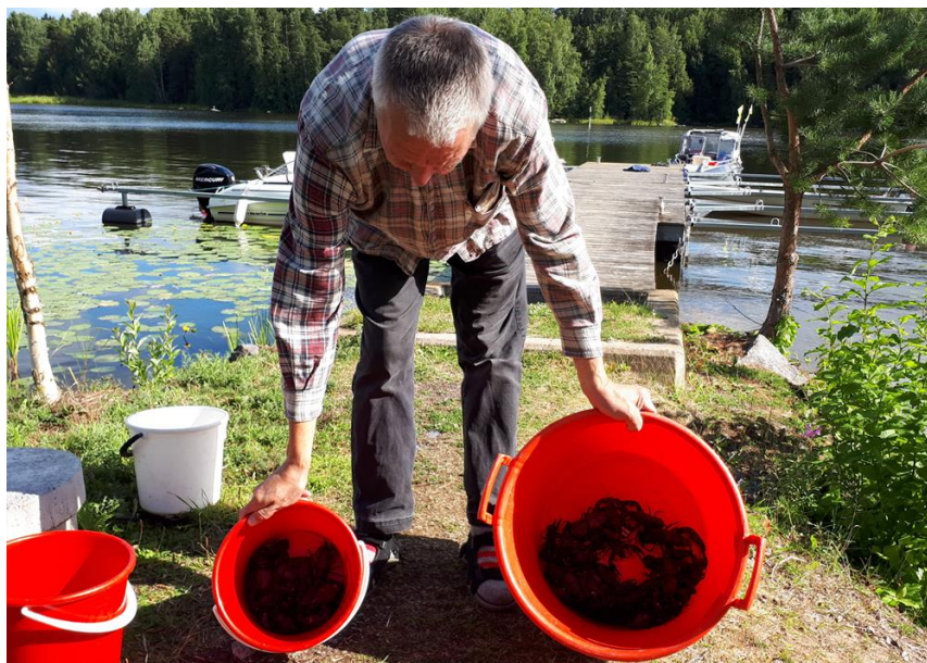
Kuva 5. Sotkanvirran niskalta tuli parhaiten täplärapuja (39 kpl). Saaliin joukossa oli myös melko kookkaita yksilöitä. 10 suurimmalla täpläravulla selkäkilven pituus oli 60–70 mm ja 10 pienimmällä 37–49 mm.

Myöskään Ratinansuvannosta ei saatu täplärapuhavaintoja. Suvanto on ylävirran puolella Viinikanlahteen ja muuhun Pyhäjärveen nähden. Virtaussuunta on alaspäin Pyhäjärveen kun Tammerkoskea juoksutetaan. Lyhytaikaisäännöstelyn takia virtaama on kuitenkin välillä olematon. Koski pannaan usein kiinni viikonlopuksi. Kun Tammerkosken juoksutus on pysähdyksissä, veden virtaus käy tiettyinä aikoina luultavasti Ratinanvuolteessa ylöspäin kohti Ratinansuvantoa (esim. kovien etelä- ja länsituulten aiheuttama kallistuma). Näin ollen myös Ratinansuvanto on käytännössä ollut Pyhäjärven rapukadon aiheuttaneen mekanismin vaikutuspiirissä.