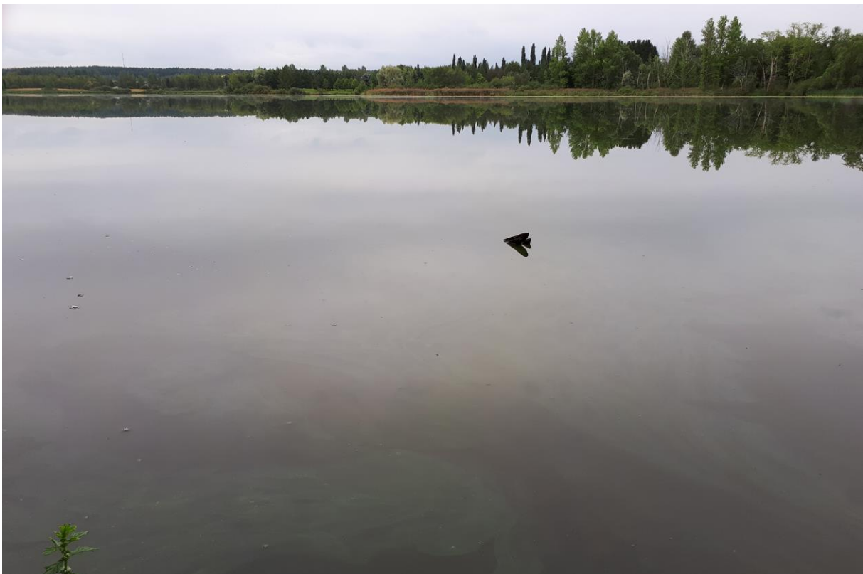
Kuva 3. Sinileväkukinta värjäsi Iidesjärven pinnan vihreäksi.

Tampereen kaupunkialueella Pyhäjärven laskevista vesistöistä saalista saatiin vain yhdestä ravustuskohteesta, Härmälänojasta. Härmälänojan koeala sijaitsee vain noin 200 metriä ylävirtaan Pyhäjärven rannasta. Sieltä saatiin saaliiksi 5 täplärapua 5 merralla (täpläravut kahdessa merrassa). Laskennallinen yksikkösaalis 1 täplärapu/mertayö oli 100-kertainen alapuoliseen Pyhäjärven itäpäähen (osa-alue 4) verrattuna.