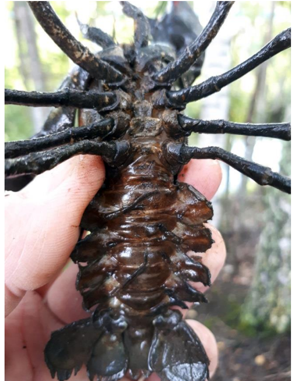
Kuvat 4 ja 5. Rehevästä ja sameavetisistä Härmälänojasta saadun tumman täplärapunaaraan pyrstöjaloissa oli pahoja syöpymiä.